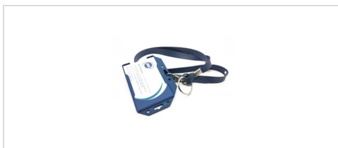
Lanyard och korthållare, detektbara

Livsmedelsgodkänd, upptäckbar med metalldetektor och röntgen