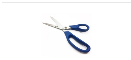
Saxar BST 9, upptäckbar med metalldetektor

Livsmedelsgodkänd, upptäckbar med metalldetektor och röntgen