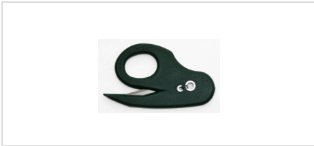
Pelikankniv, 100 % återvunnen plast Pelikankniv gjord helt av återvunnen plast. Miljövänligare alternativ.