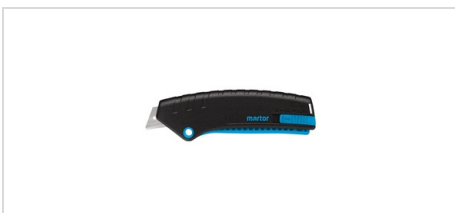
Säkerhetskniv MARTOR SECUNORM MIZAR Ergonomisk, trygg och robust säkerhetskniv. Det glasfiberförstärkta handtaget består av minst 80 % återvunnen plast.