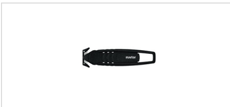
Nyhhet! Säkerhetsskärare SECUMAX 148 Önskar du mer miljövänliga alternativ? Säkerhetsknivar i återvunnen plast?