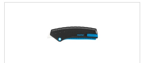
NYHET! Säkerhetskniv SECUNORM MIZAR med kermaiskt knivblad Tummen upp - för hög säkerhet! Det glasfiberförstärkta handtaget innehåller dessutom minst 80 % återvunnen plast