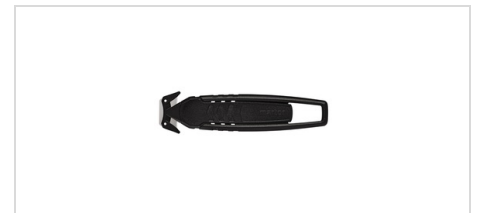
Säkerhetskniv Martor SECUMAX 150 Liten men robust säkerhetskniv.