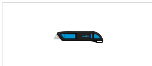
Säkerhetskniv Secunorm 300 Lätt, hållbar men förmånlig säkerhetskniv. Handtaget består av minst 60 % återvunnen plast och är förstärkt med glasfiber.