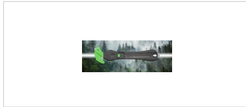
Säkerhetskniv KLEVER ECO EXCHANGE Letar du efter en hållbar allroundtalang med stor variation och maximal säkerhet, men vill ändå ha en särskilt ekonomisk lösning? Det återanvändbara knivhandtaget är tillverkad av 100 % återvunnen plast.