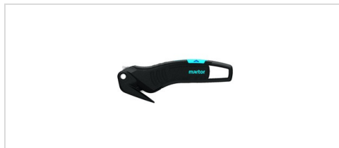
Säkerhetskniv Martor Secumax 320 En ny generation säkerhetskniv för att skära i olika plastfilmer, tejp och förpackningsband. Ergonomisk, hållbar och trygg att använda